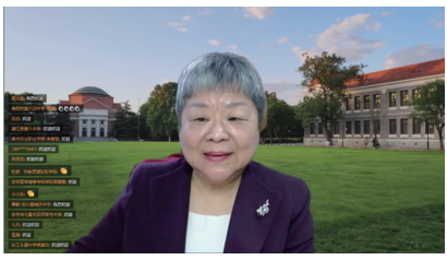
樊富珉教授作题为《积极心理学视角下学校心理健康教育新模式——从心理问题干预到积极品质培育》的专题报告

省学校心理健康教育工作高质量发展和“我为群众办实事”实践活动的重要平台。自开设以来,省委教育工委 省教育厅邀请全国知名专家学者授课指导,汇聚专家智慧,主动链接优势资源,累计 5000 余人次参加培训。首批贵州省普通高等学校心理健康教育与咨询示范中心主动承办,发挥示范中心辐射作用,形成心理育人合力,推进了教育系统心理健康教育工作高质量发展。