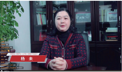
贵州省委教育工委副书记、教育厅党组成员杨未出席并讲话